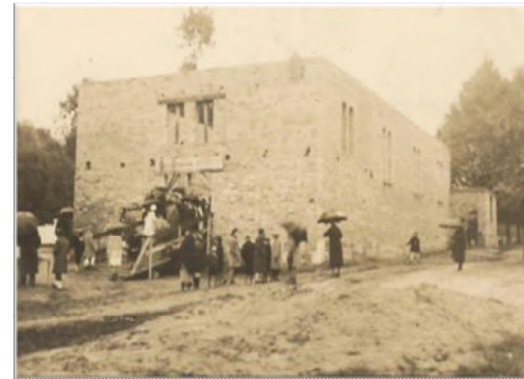
Mise a készülő templomban