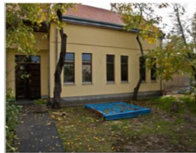
Nagy öröm a Közösségi Ház